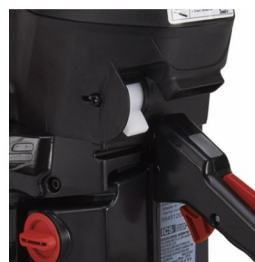
Nouveau système de démarrage