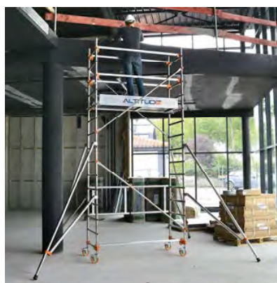
AL165 version base pliante Hauteur travail 4.80 m