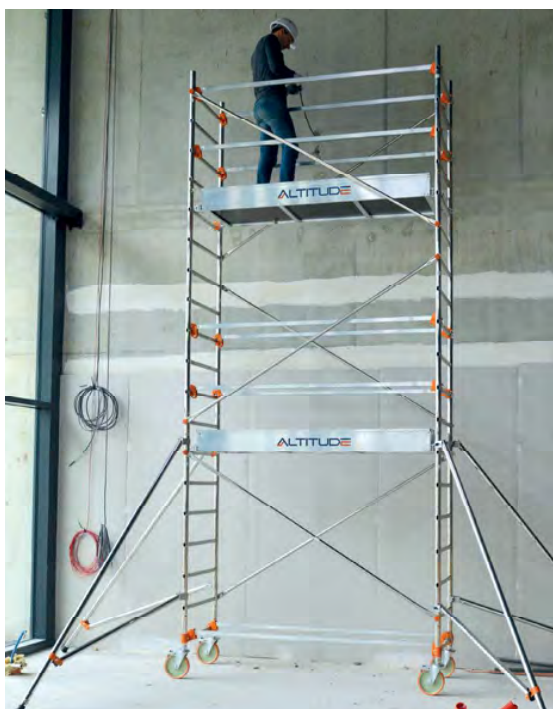
AL205 version standard Hauteur travail 5.90 m