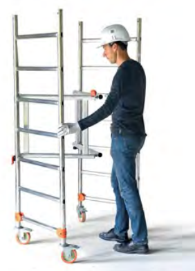
Installation express de la base pliante