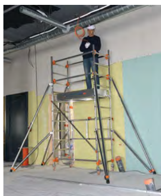
AL135 version base pliante Hauteur travail 3.80 m